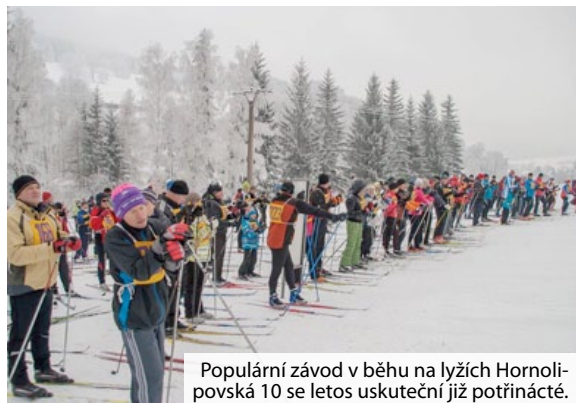
Populární závod v běhu na lyžích Hornolipovská 10 se letos uskuteční již potřinácté.

Už potřinácté se sejdou v Horní Lipové milovníci „bílé stopy“, aby změřili síly v závodě Hornolipovská 10. Závod v běhu na lyžích se uskuteční v sobotu 18. ledna.